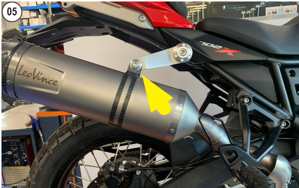
FIT THE LeoVince MUFFLER AND SCREW