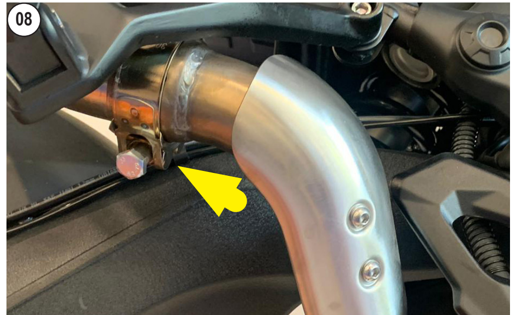
SCREW THE STOCK CLAMP