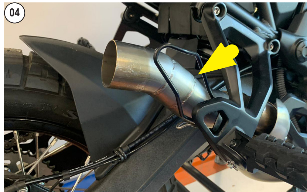
INSTALL THE LeoVINCE PIPE