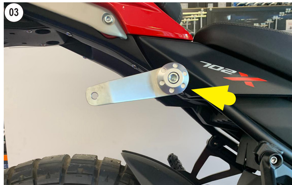
FIT THE BRACKET